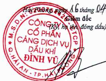
Đặng Kiến Nghiệp